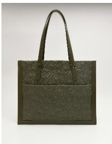
標誌尼龍雙肩包3990元