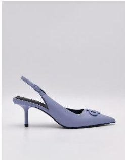
標誌皮革尖頭高跟鞋2890元

PEDRO Icon是品牌的經典系列，以雙P圖案構成的系列logo、充滿藝術感的設計與精巧細膩的皮革運用，標誌出充滿時髦都會氛圍的男女鞋包。本季PEDRO Icon 鞋款包含經典耐穿的男女樂福鞋、休閒鞋、優雅的高跟鞋、率性的穆勒鞋、時髦帥氣的高筒休閒男鞋等。包款則以雙P圖案為設計元素，橢圓單肩包搭配粗針織背帶讓整體穿搭更俐落有型；拼接單肩包硬挺的包型及金屬logo帶有奢華感，無論正式或休閒場合都能讓精緻度升級；方型單肩包及尼龍雙肩包，簡約內斂的中性設計讓男女都愛不釋手。