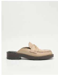
標誌皮革穆勒鞋3290元