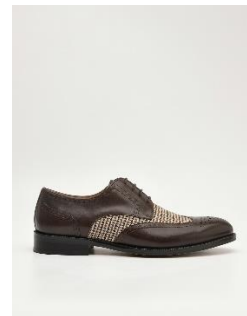
皮革布洛克德比鞋 4390 元