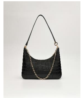
Bardot 皮革單肩包 4490 元