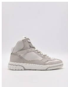
標誌高筒運動鞋3690元