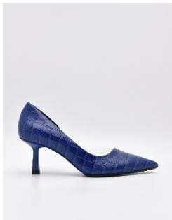
Helens 皮革高跟鞋 3190 元

獻給充滿熱情與追求卓越的女性，PEDRO Studio頂級鞋包系列運用精緻皮革，為女性帶來自信與力量的同時，也可以舒適自在地向前邁進。2022冬季主打Kate皮革信封包，流暢簡約的外型與精細的皮革做工，讓這款硬挺方包成為衣櫃中不可或缺的經典單品，是PEDRO品牌低調奢華風格的代表；Bardot皮革單肩包的結構包身加上細緻的金屬鍊條裝飾，將女性自信無畏的態度表露無遺。鞋款的部分則以出其不意的細節擄獲你的目光：Helens皮革高跟鞋的鱷魚壓紋鞋面加上側邊的透明設計，讓平凡的高跟鞋變身為整體造型焦點；Kristen皮革平底鞋則以暖灰與米杏的撞色搭配與恰到好處的尖頭設計，成功傳達出低調優雅的女人味。