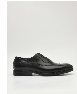
Dylan 皮革牛津鞋 4090 元