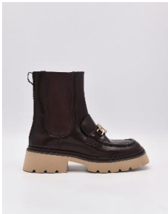
皮革厚底切爾西靴4890元

PEDRO冬季焦點商品創新的色彩及流暢的輪廓，洋溢著時髦精緻的大人感。以軍綠色、焦糖棕、深咖啡及米杏色等中性氣質色調，穿插清新亮眼的紫羅蘭色，並運用經典方型格紋、細緻毛呢與彩色千鳥細紋等圖案，提升整體造型的質感，打造屬於冬季的優雅穿搭。