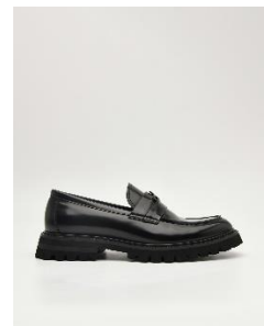
標誌皮革樂福鞋3890元