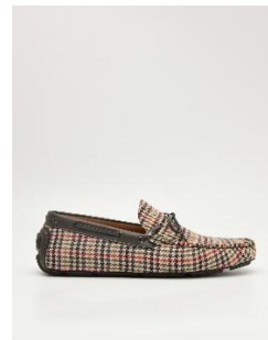
Michael蝴蝶結莫卡辛鞋2990元