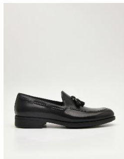
流蘇皮革樂福鞋 3790 元