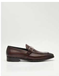
金屬扣皮革樂福鞋 3790 元

靈感來自於活力旺盛及眼光獨具的男性，PEDRO Altitude 巧妙融合經典鞋型與活潑有趣的設計細節，打造出一系列現代感十足卻又不同流俗的正裝鞋款。金屬扣樂福鞋以修長的鞋型帶出溫文儒雅的氣質，金屬扣裝飾讓整體風格更精緻有型；流蘇皮革樂福鞋則以略為圓頭的鞋型設計、鞋面的流蘇及側邊的穿繩細節，傳遞出時髦不羈的態度；皮革布洛克德比鞋則將英國紳士風格代表的布洛克(Brogue)雕花鞋型，大膽地穿插雙色千鳥格紋拼接，創造出復古吸睛的效果；Dylan皮革牛津鞋以拋光小牛皮的精緻材質，加上輪廓乾淨、線條流暢的外型，表達出摩登現代的優雅感。此外，本系列所採用的熱塑性橡膠材質，使鞋子更輕量舒適且便於穿著，讓男士們在翻玩日常穿搭之餘，能同時靈敏自在地活動穿梭。