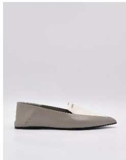
Kristen 皮革平底鞋 2990 元