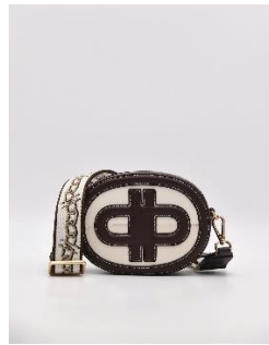
標誌皮革橢圓單肩包3690元