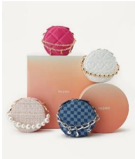
四合一迷你包禮盒6900元

迎接聖誕及年末派對季節，PEDRO以具有貴族氣息的土耳其藍與洋紅紫為主調推出歡慶聖誕系列，無論是要盛裝參加派對聚會，或是給鍾愛的人挑選禮物，本系列的時髦單品都是絕佳選擇。四合一迷你包禮盒集結四款風格迥異的圓形迷你包，與四條可隨意拆卸搭配的華麗鏈帶，是款充滿節慶氛圍的禮物組。閃耀著光芒的土耳其藍，放在高跟鞋或是鍊條包上都亮眼迷人；帶有神祕氣息的洋紅紫，與閃色金屬線交織成毛呢鍊帶小方包，或是包覆整雙男性運動鞋，獨特的色彩讓你成為眾所矚目的焦點！