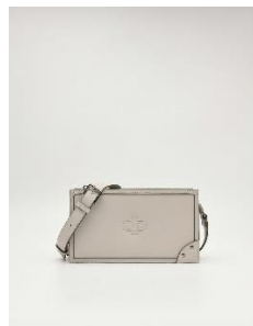
標誌方型單肩包3290元